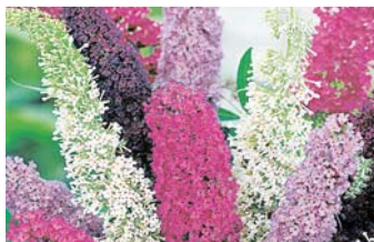
● Гортензия метельчатая