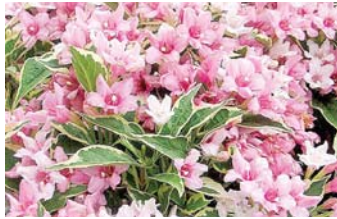
● Гортензия крупнолистная